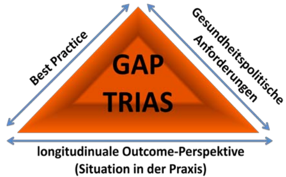
Abbildung 1: Gap Trias

Eine Kluft zwischen dem ‚was wissenschaftlich als belegt gilt‘ und dem ‚was praktisch realisiert wird‘ (knowledge-to-practice-gap) besteht (Estabrooks et al. 2008). Darüber hinaus ist auf eine Lücke zwischen gesundheitspolitischen Anforderungen und wissenschaftlichem Erkenntnisstand - z.B. Pflegezeitkorridore (Bartholomeyczik 2007) und Pflegebedürftigkeitsbegriff (Wingenfeld et al. 2007) - sowie der tatsächlichen Situation in der Praxis (gap-trias) hinzuweisen (MDS 2007).